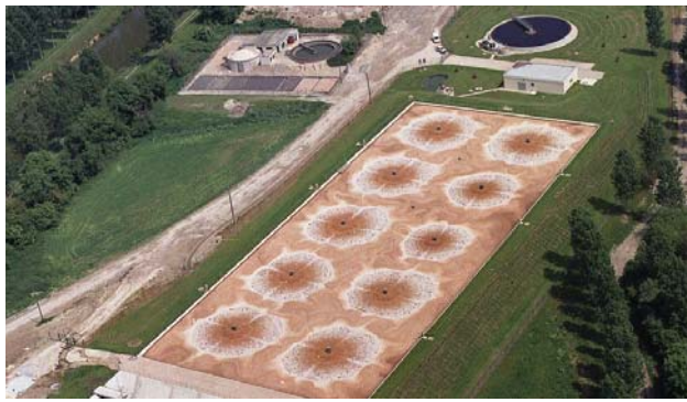
10 x 55 Kw

Industrie Agro-Alimentaire / Food process industry