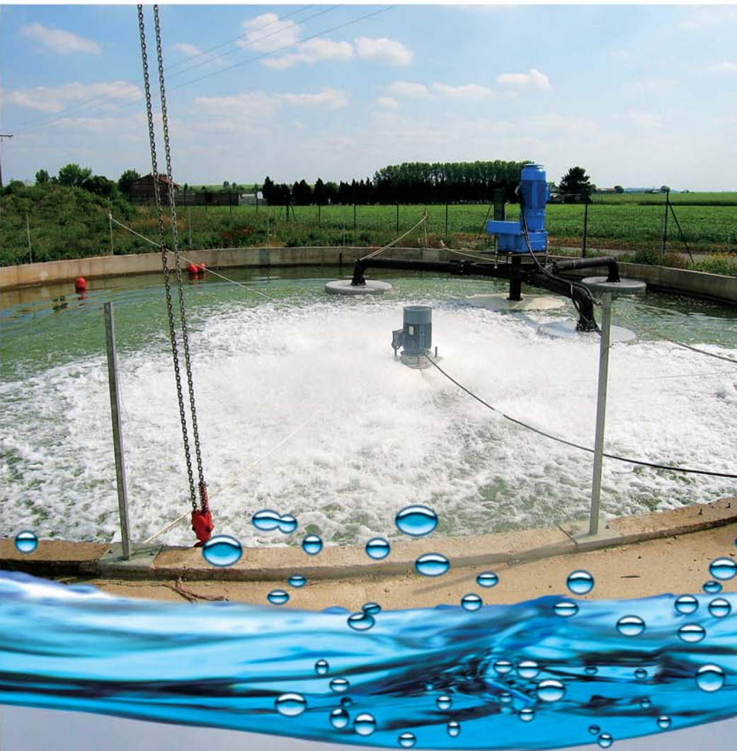
Bassin d'essai en génie civil de 1000m 3 Concrete test tank - Volume 1000 m 3

Toujours soucieux de suivre et d'améliorer ses équipements, EUROPELEC s'est doté d'un bassin d'essai qui permet à son département R&D de mettre au point et de valider les performances des produits. EUROPELEC réalise dans ce bassin, les tests de performance de ses aérateurs.