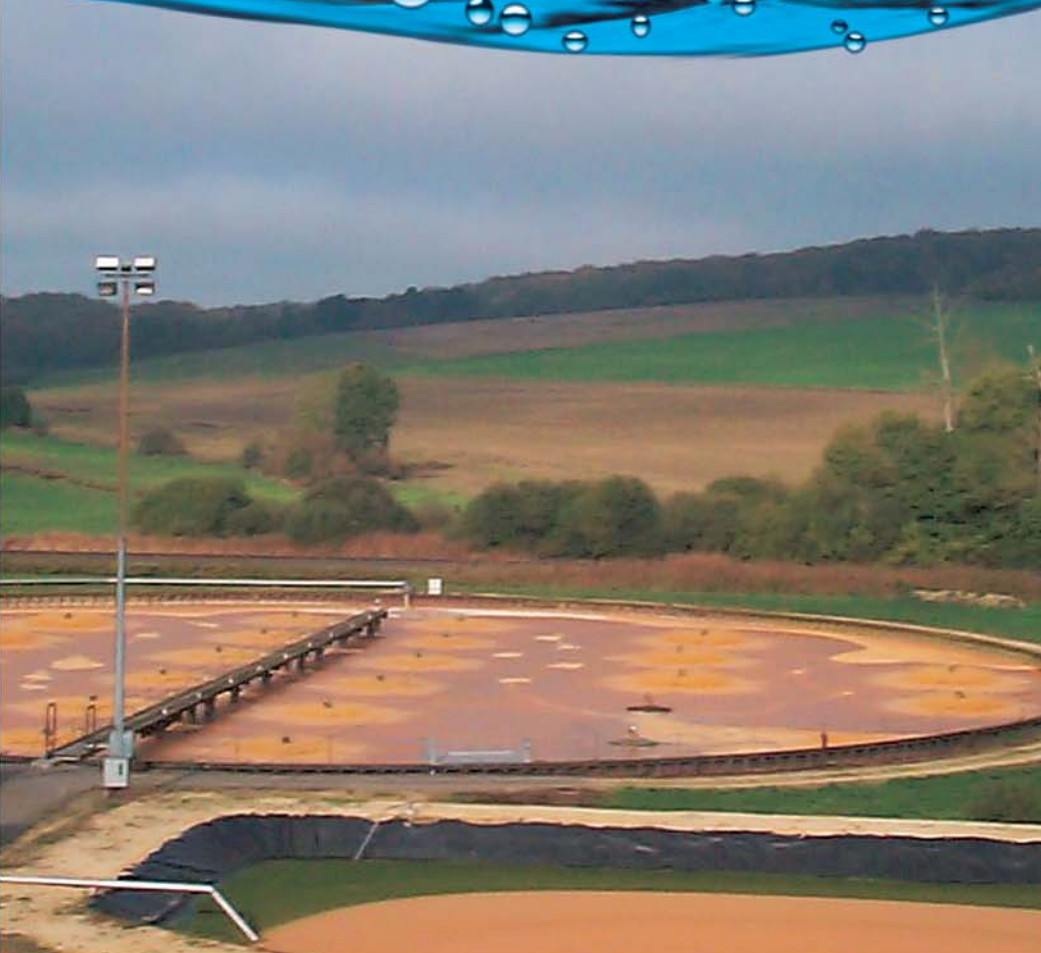
Bassin agro-alimentaire Food process industry

Always concerned to follow and improve its equipments, Europelec has been equipped with a test tank which allows its design department to develop and validate the performances of the products. Europelec realize in this test tank, performance test of its aerators.